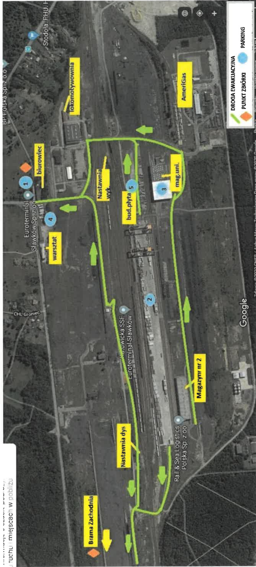
Załącznik nr 1 – Mapa Obiektu – „Euroterminal Sławków” Sp.z.o.o.