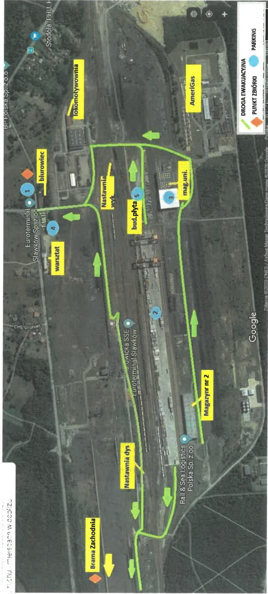
Załącznik nr 1 – Mapa Obiektu – „Euroterminal Sławków” Sp.z.o.o.